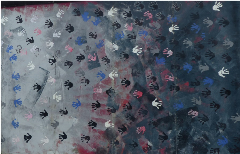
East-Side-Gallery, Berlin, Foto: Michael Tillmann

Wir tanzen dieses Jahr nicht in den Mai! Stattdessen lädt der Gebetskreis Penuël am Dienstag, 30. April, um 18:00 Uhr in St. Hildegard ein, bei Essen, Getränken und schönen Gesprächen in den Maimonat zu starten. Kommen Sie einfach dazu, ohne Anmeldung.